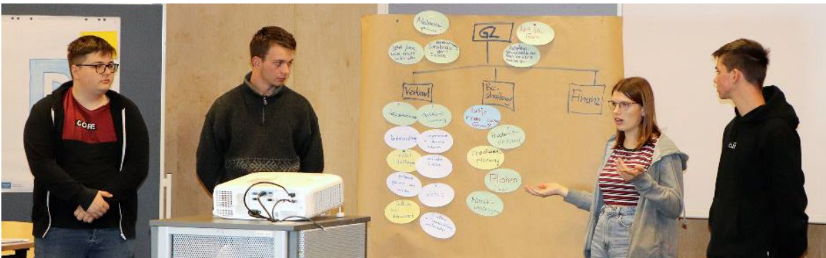
Die Lernenden im 3. Ausbildungsjahr starteten mit einem Workshop ihre Juniorenfirma (JUFA).