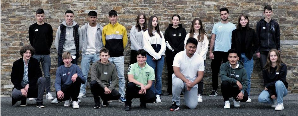
Die neuen Lernenden der Hilti Aktiengesellschaft in Schaan (hier mit drei Kolleginnen und Kollegen von der Hilti Schweiz AG) beginnen ihre Berufsausbildung in sechs Fachgebieten.